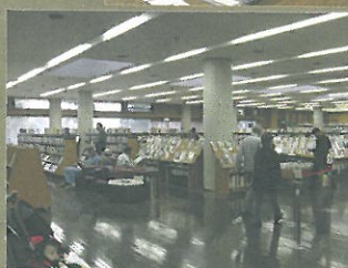
▲ 広い空間でゆったりと知的活動。