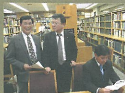
▲ 仕事を忘れて読書をしたくなる空間でした。

児童書も充実し、レファレンス機能まで有し、司書が優しく案内してくれます。見習うべき点は沢山あると感じました。